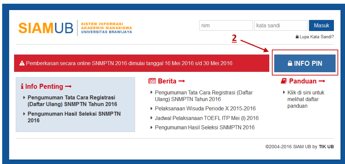
Gambar 2 Halaman Login SIAM